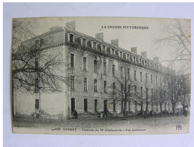
Caserne des Augustines