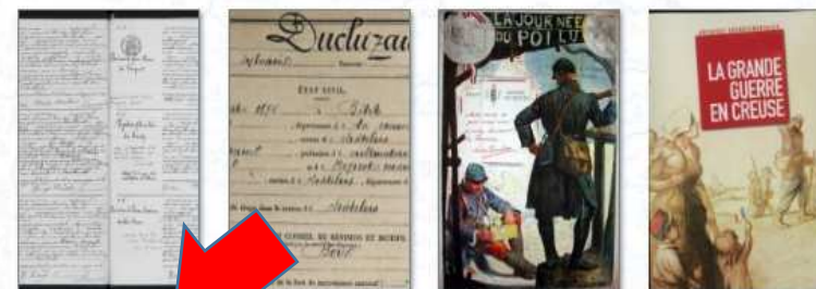
Registres paroissiaux et de l'état civil XVIIe siècle-1912

Les Archives départementales de la Creuse s'attachent depuis de nombreuses années à mettre en avant les richesses de leurs fonds par une politique de numérisation d'archives. Menée dans le respect du cadre de la loi de 2007, elle vise à rendre accessibles en ligne les registres paroissiaux et d'état-civil des communes de la Creuse.