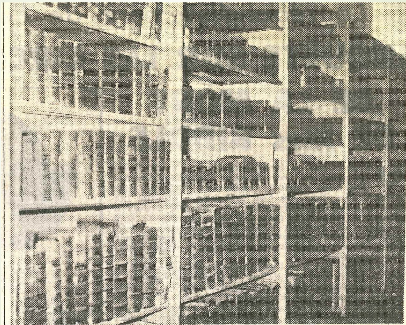
Une vue des aménagements. Les rayons où sont classés les livres précieux