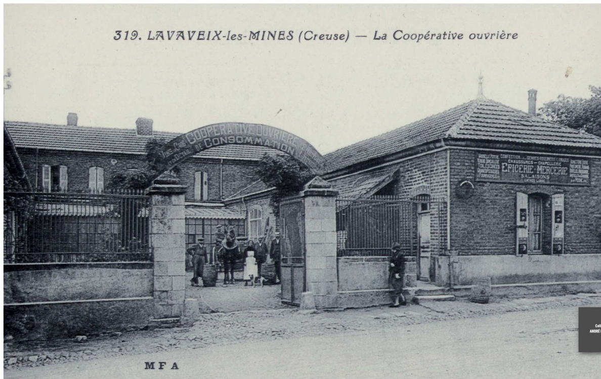
319. LAVAVEIX-les-MINES (Creuse) — La Coopérative ouvrière

SOUS LA RÉVOLUTION FRANÇAISE, LE CITOYEN EST PERÇU COMME UN INDIVIDU À PART ENTIÈRE. AU NOM DE L'EXERCICE DES DROITS INDIVIDUELS ET DE LA LIBERTÉ D'ENTREPRENDRE, LA LOI LE CHAPELIER (JUN 1791) DISSOUT LES GUILDES (ASSOCIATIONS OU COOPÉRATIONS DE PERSONNES PRATIQUANT UNE ACTIVITÉ COMMUNE), LES CORPORATIONS ET LES CONFRÉRIES.