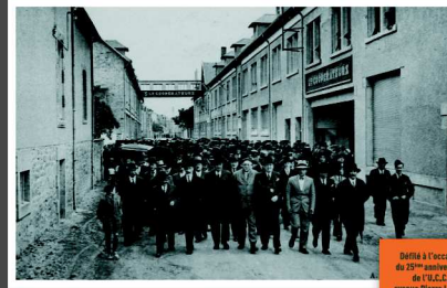
Défilé à l'occasion du 25 ème anniversaire de l'U.C.C., avenue Pierre LEROUX, 1932.