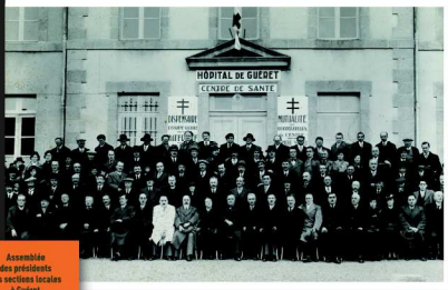
Assemblée des présidents des sections locales à Guéret, le 8 novembre 1934.