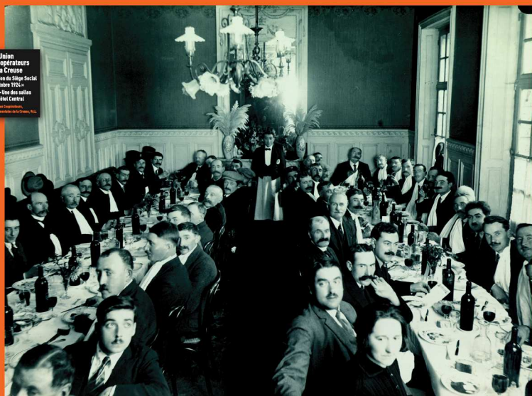
Union des Coopérateurs de la Creuse • Inauguration du Siège Social 23 octobre 1924 • Banquet dans les salons de l'Hôtel Central. Photo des Coopérateurs Archives départementales de la Creuse, 954.