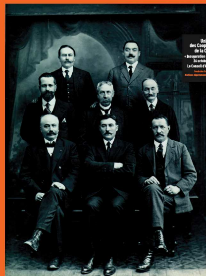
Union des Coopérateurs de la Creuse • Inauguration du Siège Social 23 octobre 1924 • Le Conseil d'Administration Photo des Coopérateurs Archives départementales de la Creuse, 954.

AVANT LA PREMIÈRE GUERRE MONDIALE, LA CREUSE EST LE DÉPARTEMENT QUI COMPTE LE MOINS DE COOPÉRATEURS (1 COOPÉRATEUR POUR 362 HABITANTS EN CREUSE CONTRE 1 POUR 29 EN HAUTE-VIENNE). MAIS EN 1907, LA CRÉATION DE « LA GUÉRÉTOISE » VA OFFRIR À LA CREUSE UNE EXPÉRIENCE FÉCONDE QUI ABOUTIRA À UNE ORGANISATION SOLIDEMENT ORGANISÉE.