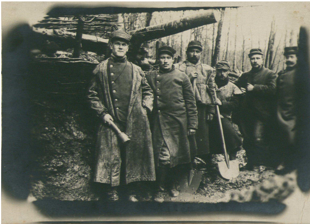
FRAD 10NUM 2013000724