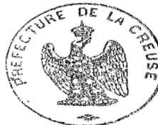
Figure 7. Arrêté de nomination du maire de Peyrat-la-Nonière par le préfet de la Creuse en 1865.

LE CONSEILLER DE PRÉFECTURE, SECRÉTAIRE GÉNÉRAL,