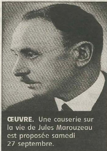
ŒUVRE. Une causerie sur la vie de Jules Marouzeau est proposée samedi 27 septembre.

➔ En plus. L'entrée est gratuite pour les enfants, 3 € pour les adultes. Pour toute information, contacter la mairie au 05.55.51.00.28, ou Marie Pascale Bonnal au 05.55.51.05.35 ou 06.33.52.39.52