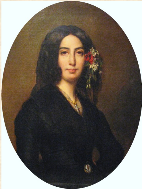
Portrait de G. Sand par Auguste Charpentier (1838). Musée de la vie romantique

Il commence ses études à Bourges puis, à 17 ans, se rend à Paris pour entamer des études de droit. Celles-ci achevées, il débute en 1831 sa carrière littéraire dans Le Figaro . A 19 ans, il rencontre Aurore Dupin, Baronne Dudevant avec laquelle il entretiendra une relation amoureuse et littéraire. Ils écriront ensemble l'ouvrage Rose et Blanche en 1831 sous le pseudonyme de Jules Sand. Par la suite l'écrivaine gardera ce patronyme et signera George Sand.