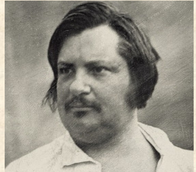
Honoré de Balzac en 1842.

En octobre 1834, il devient le secrétaire particulier d'Honoré de Balzac. Il s'installe au domicile de l'auteur et se consacre à la correction de certaines épreuves du Père Goriot . Mais l'énergie créatrice et l'activité débordante de Balzac se révéleront trop écrasantes pour Sandeau qui choisira de quitter son protecteur quelques mois plus tard...en lui laissant quelques dettes.