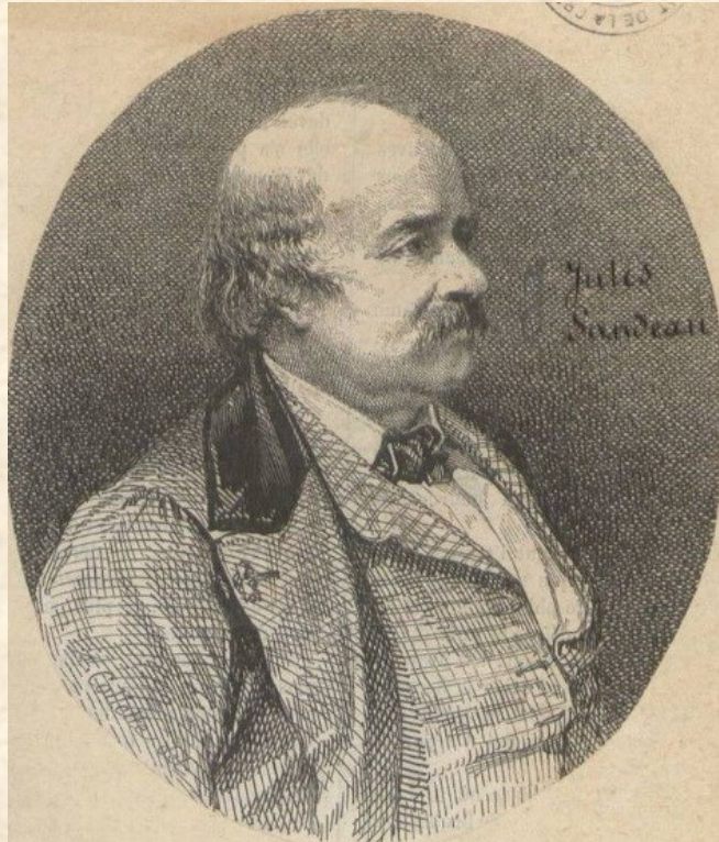
Arch.Dep.Creuse. 9Fi 70

« Je n'avais pas la tête assez solide pour vivre longtemps dans cette atmosphère géniale ». Jules Sandeau.