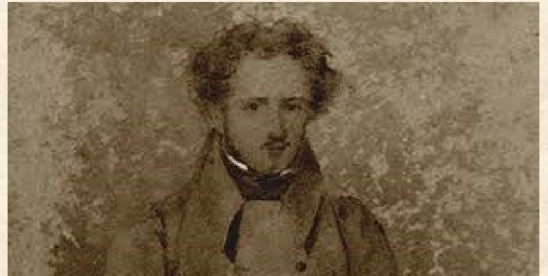
Portrait en buste de Jules Sandeau, 1831, par Georges Sand. Coll.privée.