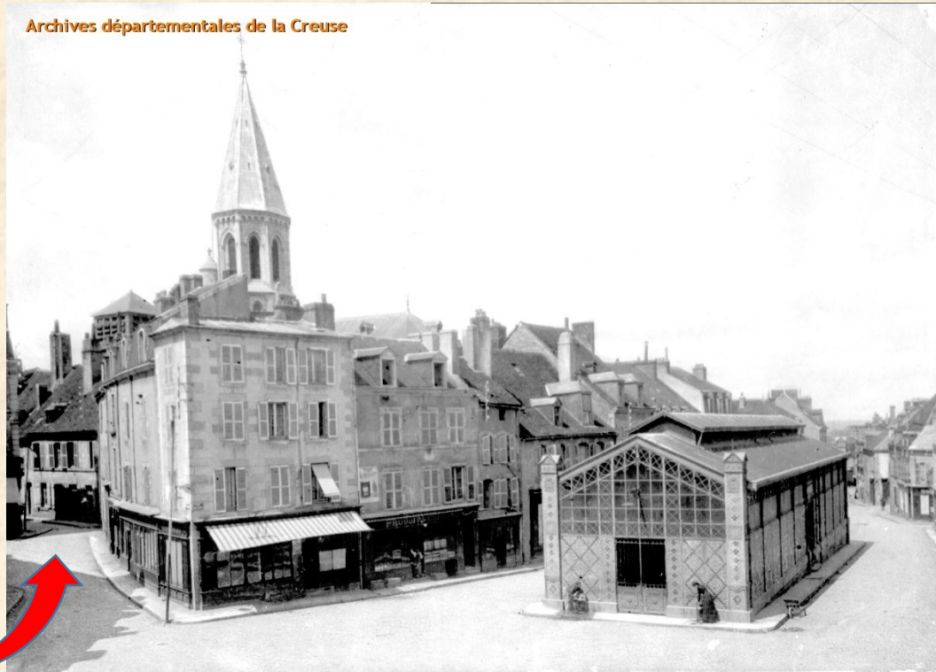
Arch. Dep. Creuse. 48Fi 84