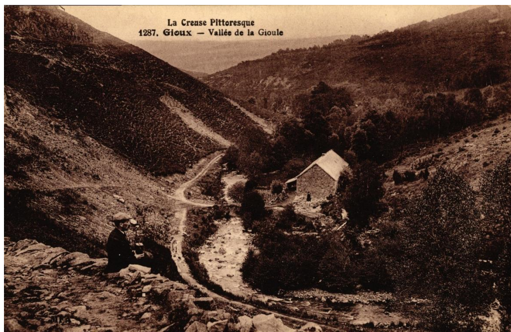
Arch. dép. Creuse 5Fi 940